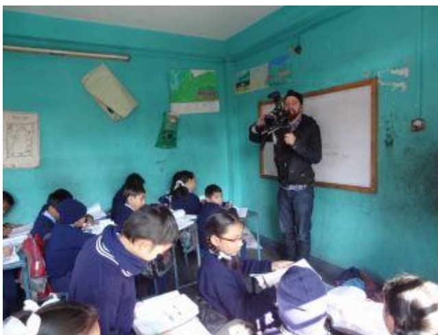
Filmning i klassrummet.