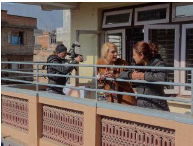
I samtal med skolans biträdande rektor.