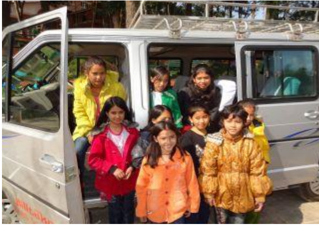
På väg i minibussen