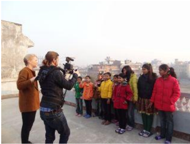
Filmning på terrassen.

Under julhelgen var det ett TV-team från SVT som träffade tjejerna på barnhemmet. De spelade in ett reportage till Lilla Aktuellt, som är ett nyhetsprogram för barn. Det hade gått jättebra och tjejerna var visst överlyckliga över att snart få komma på svensk TV!